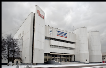
Спорткомплекс ЦСКА, Москва