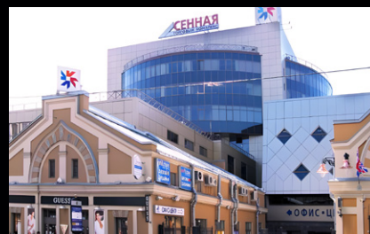
ТЦ «Сенная», Санкт-Петербург