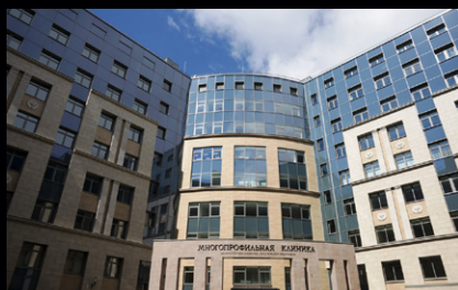
Военно-медицинская академия, Санкт-Петербург