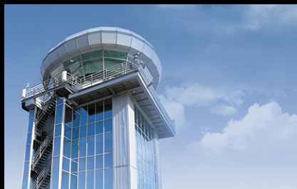
Центр управления полётами, а/п «Внуково», Москва