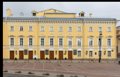
Михайловский театр, Санкт-Петербург