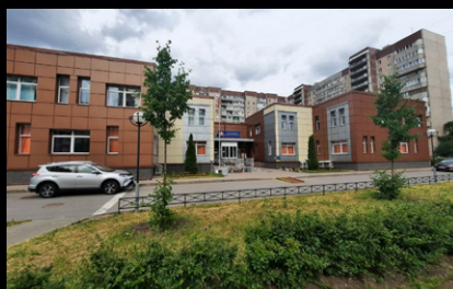
Отделения пенсионного фонда, Санкт-Петербург